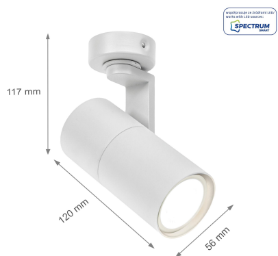
GU10. Oprawa sprzedawana bez źródła światła. MAX 10W LED; MAX 50W Halogen.