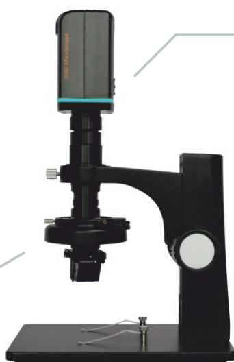
Wymiary: 68 x 66 x 310mm