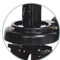
Szeroki kąt oświetlenia LED