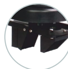
Obiektyw 2D / 3D