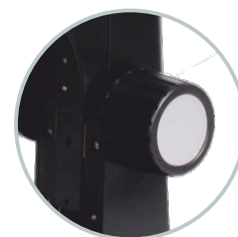
Regulowana przestrzeń robocza